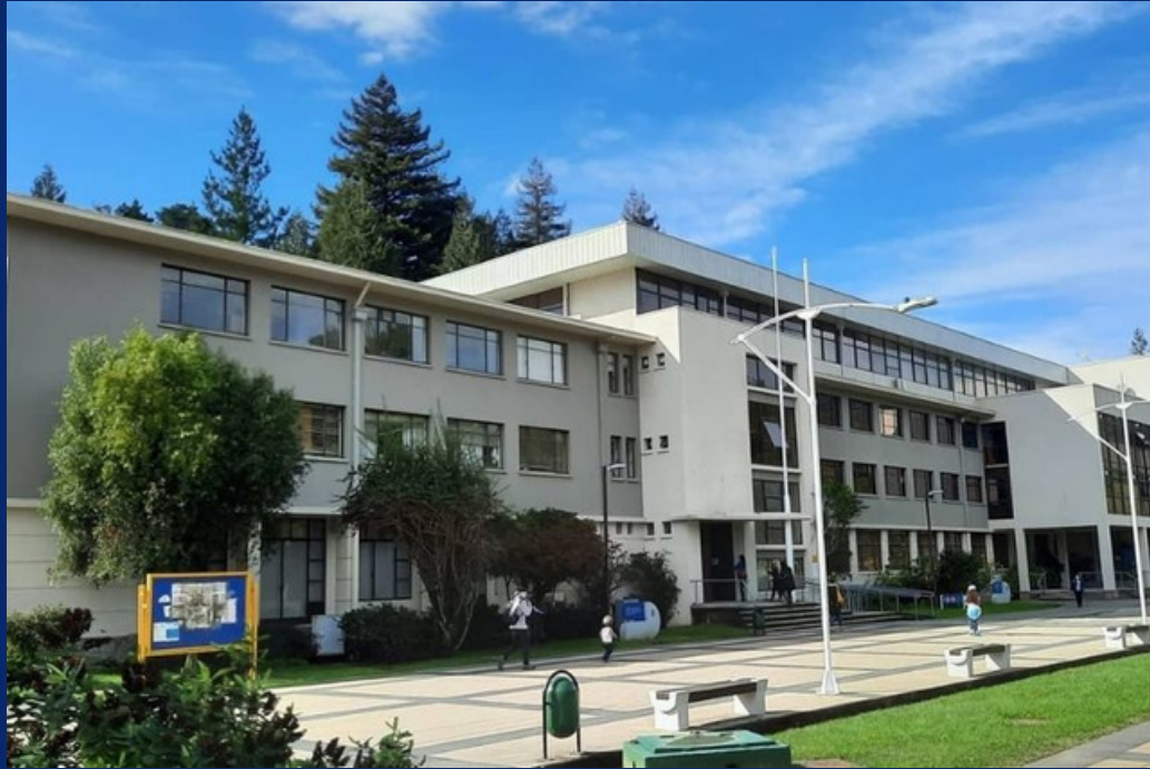
EDIFICIO VIRGINIO GÓMEZ