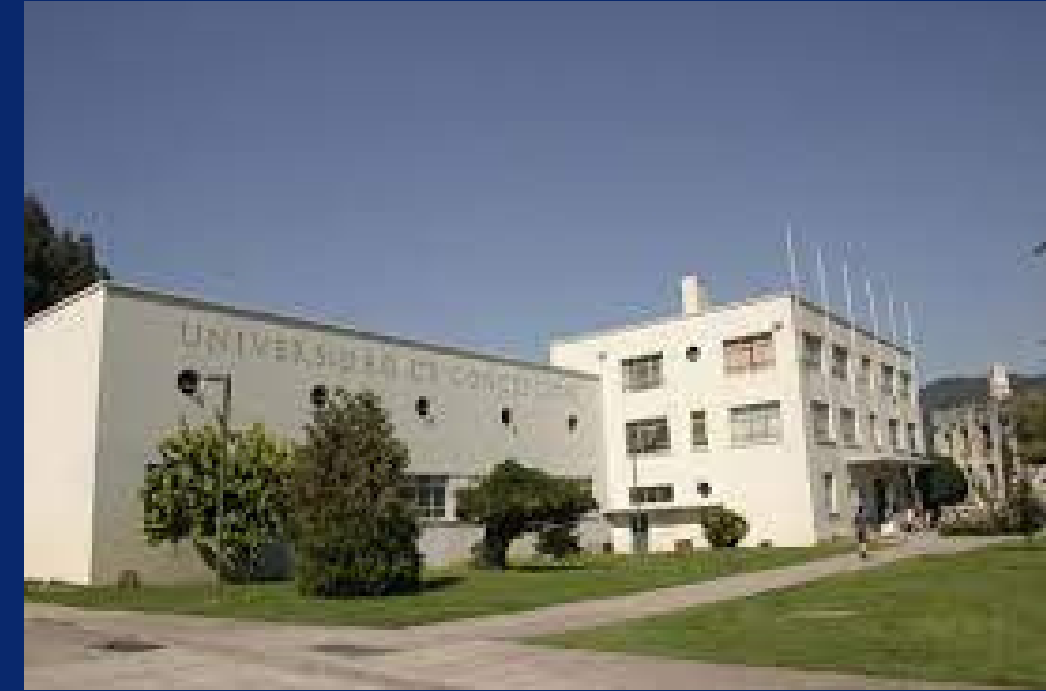
CASA DEL DEPORTE